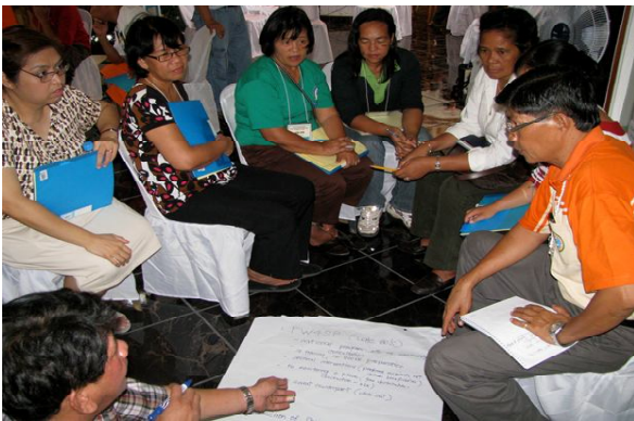
फिलीपीन्स के पूर्वी समर क्षेत्र में समूह चर्चा में प्रतिभाग करते हुए प्रशिक्षक/प्रतिभागी।

उपरोक्त विवरण केवल सुझावात्मक हैं, यह अत्यन्त व्यवहारिक पाये जाने के कारण समय एवं क्रम का निर्धारण हुआ है पहला दिन अत्यन्त व्यस्त एवं बड़ा होता है अतः प्रतिभागी कहते हैं कि दूसरे दिन ट्रिगरिंग के लिये जाना सम्भव नहीं है लेकिन बिना देर किये अपने हाथ से स्वयं कर के सीखने के सम्बन्ध में बहुत कुछ कहा गया है।