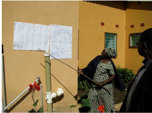
जाम्बिया के विसाम्बा में ट्रिगर हुए समुदाय की महिला प्रस्तुतीकरण देते हुए।

फ्लिप चार्ट पर उद्देश्यों को लगाना चाहिये तथा इसे पढ़ा जाना चाहिये और प्रतिभागियों से पूछा जाना चाहिये कि उन्हें यह समझ में आ रहा है या नहीं यदि कोई और स्पष्टीकरण की आवश्यकता हो तो अवश्य दिया जाये।