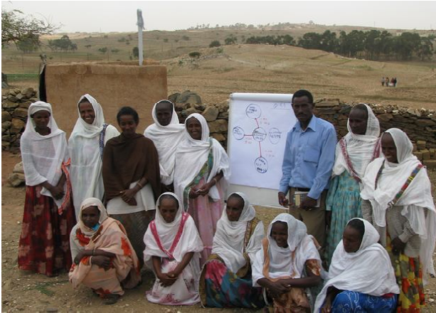
दोषी तरफ- गाँव के मुखिया के साथ स्वाभाविक नेता खड़े हैं तथा पास में तीन गाँव के मानचित्र लगे हैं। बाँयी तरफ - गुजरात के पोरबन्दर में महात्मा गाँधी के जन्म स्थान पर स्वाभाविक नेता अपने गाँव को खुले में शौच से विमुक्त करने हेतु शपथ लेते हुए।

सी.एल.टी.एस. का सुगमकर्ता वह व्यक्ति है जो सीधे समुदाय में अथवा गाँव में सी.एल.टी.एस. की पद्धति के माध्यम से ट्रिगर करता है। सरकारी अथवा गैरसरकारी संगठनों में समुदाय के स्तर पर कार्य करने