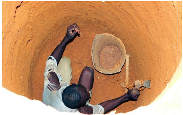
ट्रिगरिंग के 24 घण्टे के भीतर माली में कोलोकानी के पास के गाँव में समुदाय के लोगों ने 35 गढ़वे खोदे तथा शौचालय निर्माण प्रारम्भ किया।

औपचारिक या अनौपचारिक ढंग से गाँव में चुना हुआ व्यक्ति हो सकता है। सामान्यता स्वाभाविक नेता खुले में शौच की विमुक्ति का स्तर प्राप्त होने के बाद भी अपने प्रयासों को रोकते नहीं हैं अपितु सामान्य जन की अन्य आवश्यकताओं जैसे आजीविका, भोजन, शिक्षा, सुरक्षा अथवा प्राकृतिक आपदा के लिये प्रयास करते हैं।