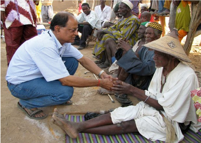
स्थानीय समुदायिक मुखिया के प्रति आदर भाव दिखाना आवश्यक है। सी.एल.टी.एस. ट्रिगरिंग के सत्र को प्रारम्भ करने से पहले माली के एक गाँव में मुखिया का अभिवादन।

कि उसे सामुदायिक विश्लेषण की कौन सी गतिविधियों का फिल्मांकन करना है। केवल एक दो समूहों तक ही अपना भ्रमण सीमित न रखें बल्कि कोशिश करें कि अधिक से अधिक समूहों को सी.एल.टी.एस. ट्रिगरिंग करते हुए आप देख सकें। इसलिए आप तेजी से कैमरा मैन के साथ बिना अधिक समय गवाएं भ्रमण करें। कमजोर समूह पर अपना समय ज्यादा दे सकते हैं। भ्रमण के लिये वाहन का प्रयोग करें।