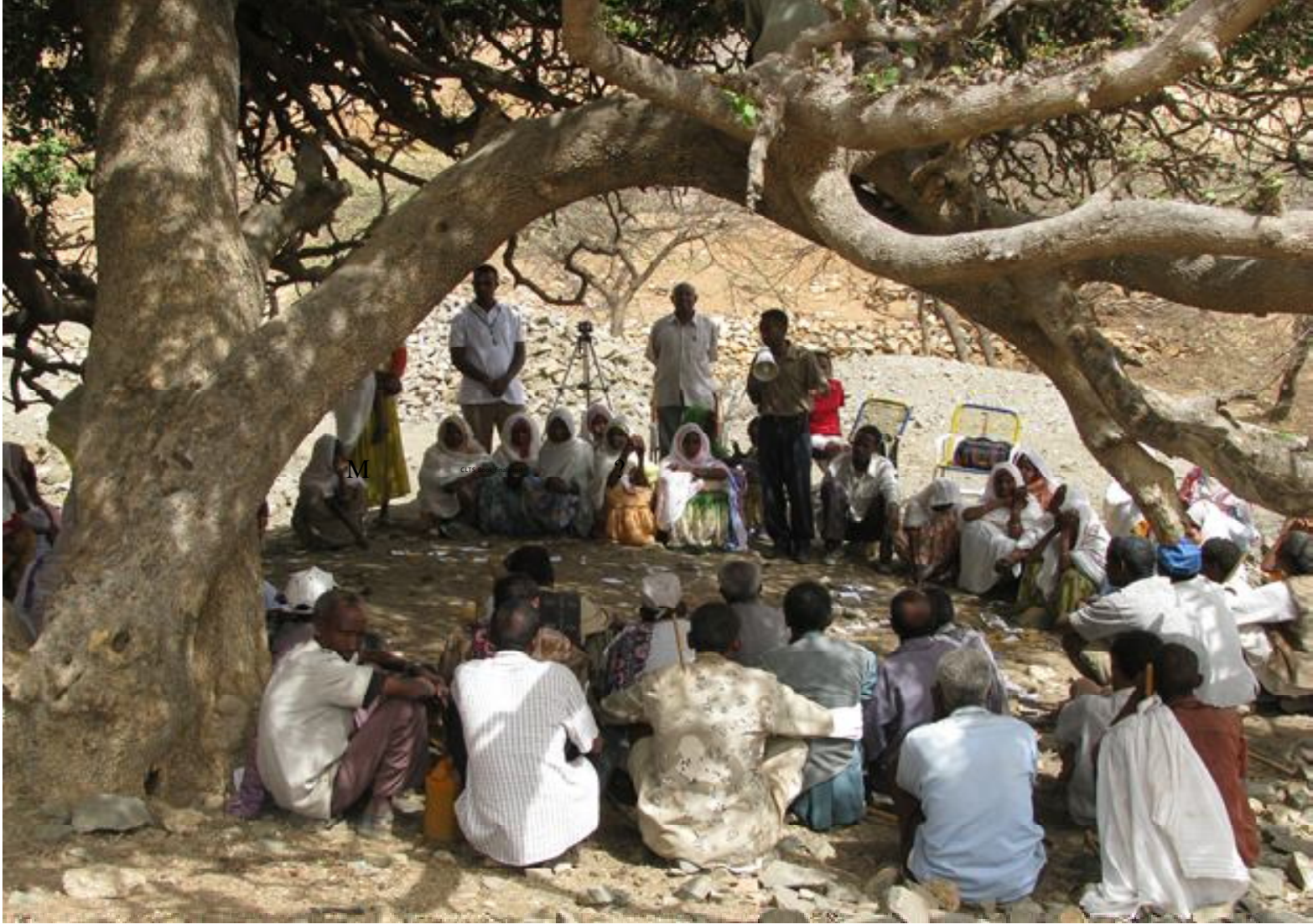
विडियो फोटोग्राफर को शान्तिपूर्ण ढंग से ट्रिगरिंग की गतिविधि में बिना व्यवधान डाले हुए छायांकन करने हेतु निवेदन किया गया।