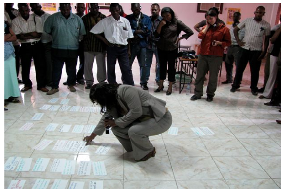
मोजाईक में प्रतिभागियों की अपेक्षाओं के कार्डों को वि-य के अनुरूप क्रम से लगाते हुए प्रशिक्षक।

प्रतिभागियों के बीच सभी की राय लेते हुए प्रशिक्षण के दौरान व्यवहार तथा बातचीत के नियम निर्धारित किया जाना चाहिये जैसे प्रतिदिन कक्षा में कितने बजे आयेगें, शाम को कितने बजे तक कक्षा चलेगी, मोबाइल फोन को बन्द रखना, जब एक व्यक्ति बोल रहा हो तो दूसरा हस्तक्षेप न करे, समूह कार्यों के लिये समय अवधि निर्धारित करना, समय को ध्यान में रखकर याद दिलाए वाले की तैनाती करना जो सीटी का प्रयोग कर सकता है अथवा ताली बजाकर समय के प्रारम्भ होने तथा समाप्त होने का संकेत कर सकता है जिसका सभी प्रतिभागी अनुसरण करें।